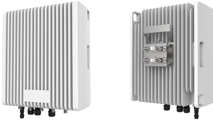
ローカル 5G 一体型基地局装置「FB2000SS」