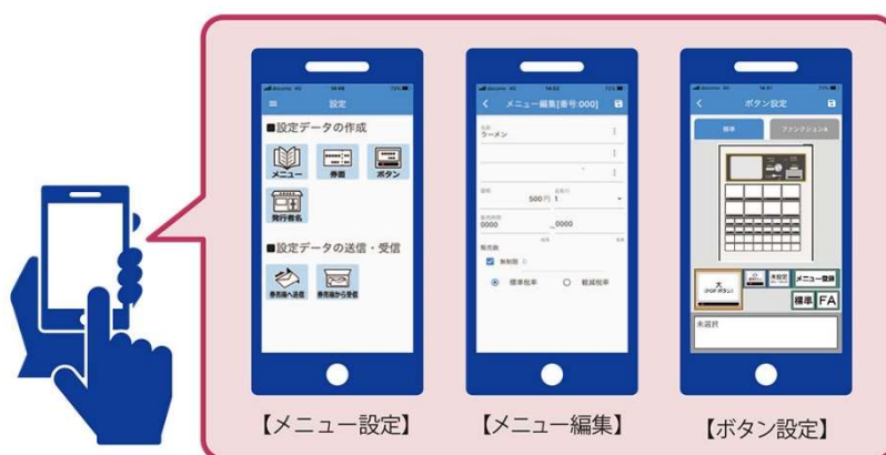
(BT-L350 の場合のイメージ)