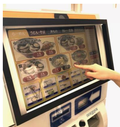
取り付けイメージ