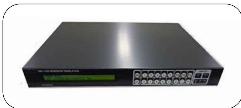
上記は塗装色ブラックです。

（ブラック：TXC-101DTR-9B、アイボリー：TXC-101DTR-9A）