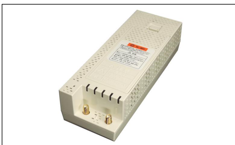
音声対応 LTE ルータ uM320V 外観図(1)