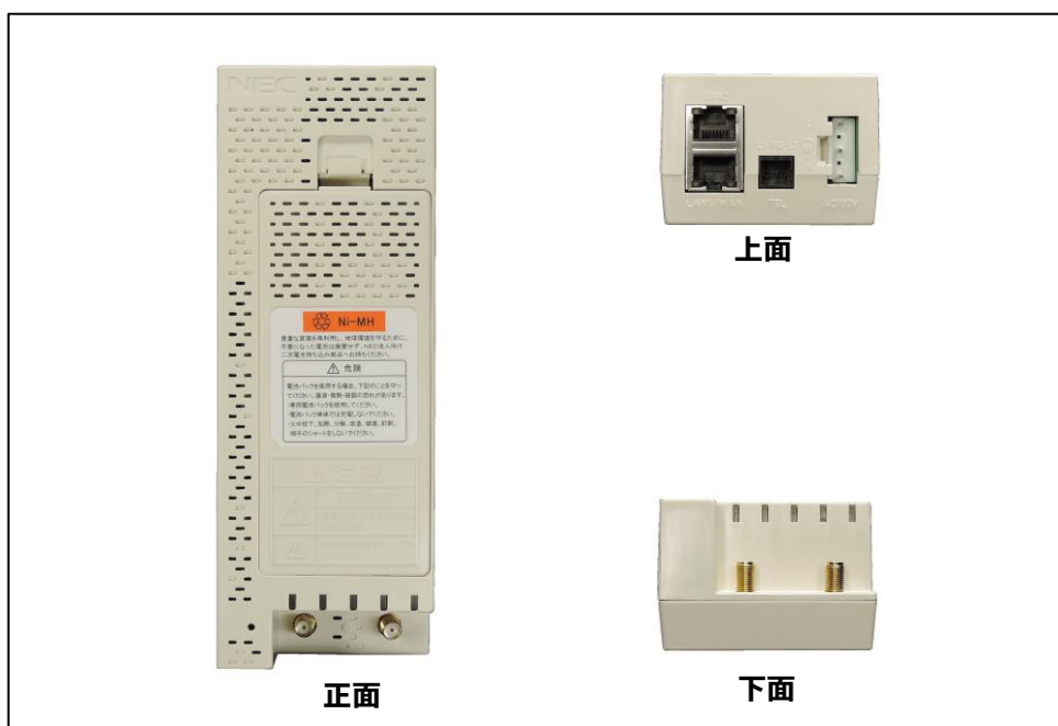
音声対応 LTE ルータ uM320V 外観図(2)